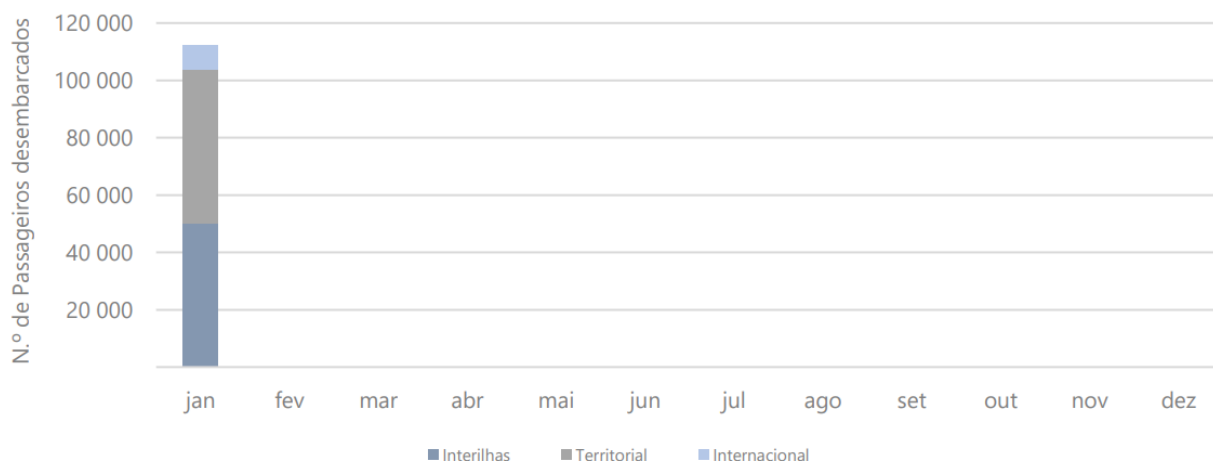
Figura 2 – Desembarque de passageiros nos aeroportos dos Açores, por tipo de voo – 2025

Por ilha, em janeiro, as que apresentaram variação homóloga mensal positiva no desembarque de passageiros aéreos, foram: Pico (27,1%), Corvo (26,3%), São Jorge (0,8%) e Santa Maria (0,3%). Em sentido contrário, Faial (-9,2%), São Miguel (-5,4%), Flores (-2,8%), Terceira (-2,7%) e Graciosa (-2,0%) apresentaram variação homóloga mensal negativa no desembarque de passageiros aéreos.