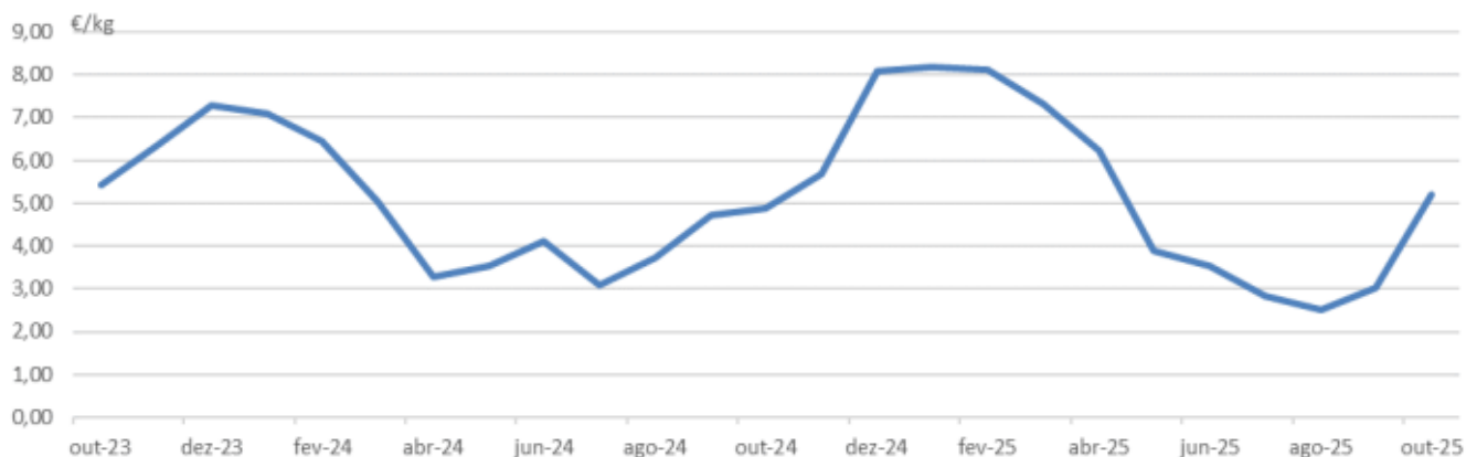
Figura 2 – Preço médio do pescado descarregado em lota