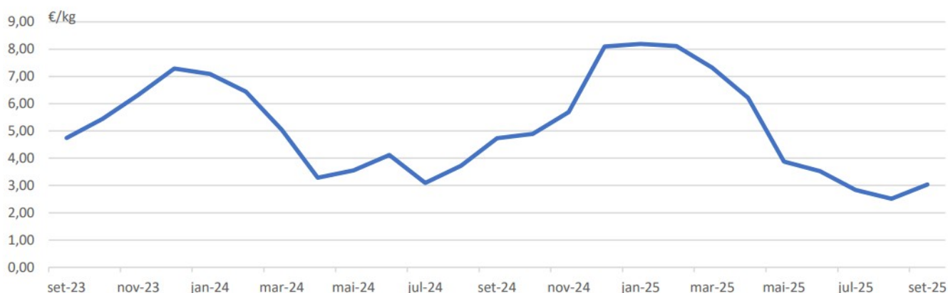
Figura 2 – Preço médio do pescado descarregado em lota