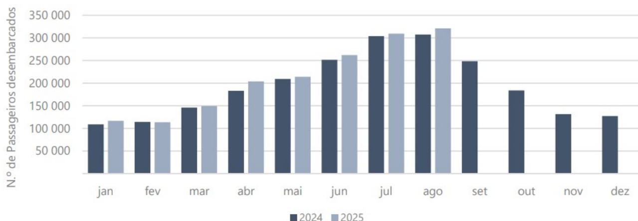
Figura 1 – Desembarque de passageiros nos aeroportos dos Açores

Nos aeroportos dos Açores, em agosto, os passageiros desembarcados verificaram-se com maior intensidade em voos interilhas (47,4% do total de passageiros desembarcados), seguindo-se os desembarcados em voos territoriais (35,7%) e os desembarcados em voos internacionais (16,9%).