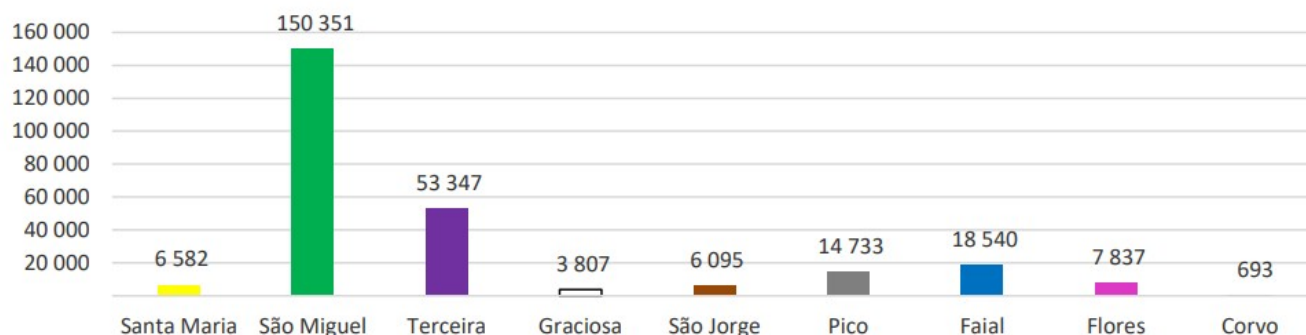
Figura 3 – Desembarque de passageiros, por ilha, no mês de referência.

Relativamente à variação homóloga dos passageiros desembarcados por ilha no segundo trimestre de 2025, todas apresentaram variação positiva, exceto Santa Maria (-1,1%): Corvo (17,4%), Flores (9,2%), Faial (8,8%), Graciosa (8,6%), Pico (7,6%), Terceira (6,0%), São Miguel (5,1%) e São Jorge (4,7%).