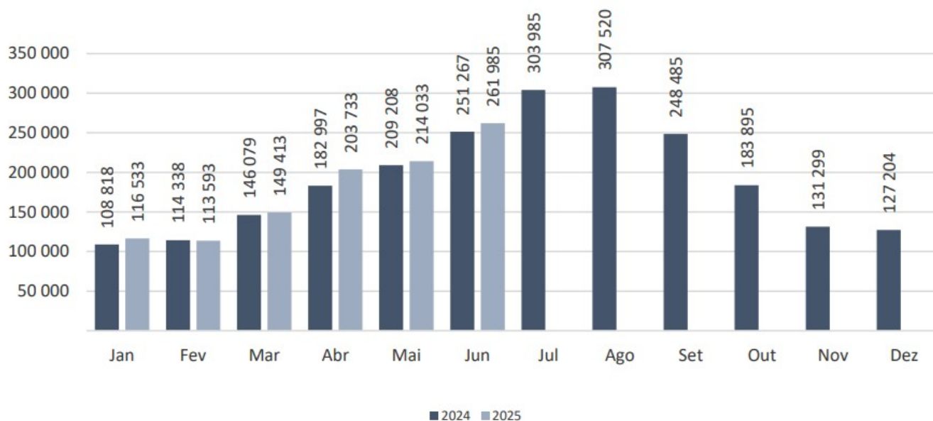
Figura 2 – Desembarque de passageiros, por tipo de voo, nos aeroportos dos Açores – 2025.