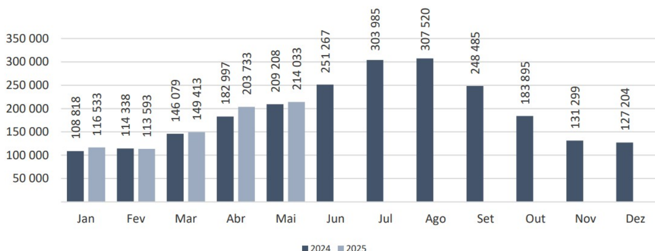
Figura 1 - Desembarque de passageiros nos aeroportos dos Açores.

Quanto ao desembarque de passageiros, também por tipologia de voo, ocorreu acréscimos mensais homólogos de 13,3% nos voos internacionais e de 1,4% nos voos territoriais, enquanto nos voos interilhas observou-se uma variação homóloga igualmente negativa de 0,5%.