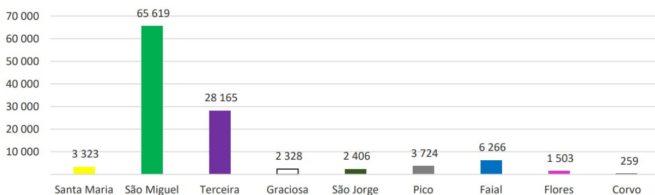
Quadro 2 - Passageiros desembarcados por ilha.