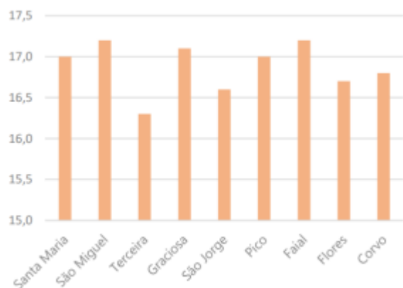
Figura 2 – Quantidade de Precipitação total no mês de referência (mm)